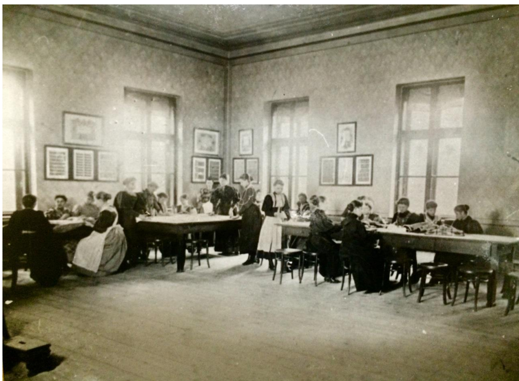
Gazdinská škola, 20. roky 20. storočia.

Snahy po zrovnoprávnení mužov a žien v spoločnosti trvali v minulosti takmer celú jednu generáciu. K ambíciám ako dosiahnuť rovnaké práva a získať možnosti a životné podmienky ako mali muži, začalo výrazne dopomáhať vzdelávanie žien. Išlo o dôležitý moment, ktorý zmenil pohľad na úlohu ženy v spoločnosti zo ženy v domácnosti a matky na pracovníčku. Okrem toho, začiatkom 20. storočia, aj keď veľmi ojedinele, môžeme vidieť študovať dievčatá i na gymnáziách i vyšších odborných školách, čo im pozvoľne otvára cesty i na štúdiá na univerzity. Štúdiá im tak umožnili uplatniť sa ako učiteľky v materských školách, či ako učiteľky predmetov zameraných na ručné práce, ale aj ako zdravotné sestry, opatrovatelky a pod.