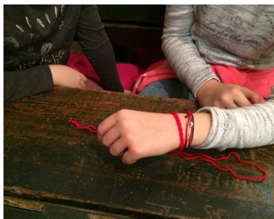
Aktivity na vzdelávacom programe Ihla a háčik v zabudnutí približujúce školské ručné práce – prišívanie gombíka, výroba náramku.

Pracovať so skupinou systémom „všetci naraz“, odrážajúc sa pritom od historickej pravdy, bolo vzhľadom na odlišné schopnosti jednotlivých žiakov a časové ohraničenie programu náročné. Nevýhodou je aj výstavný priestor, umožňujúci na jeden vstup obmedzené množstvo detí. Ak by sme chceli program o histórii ručných prác ešte zdokonaľiť, ideálne by pri väčších žiakoch bolo viesť súčasne hodinu zvlášť s dievčatami a zvlášť s chlapcami, využívajúc pri tom lektorku a lektora.