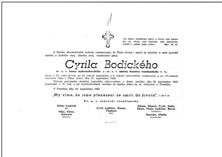
Parte C. Bodického. Archív Národného biografického ústavu SNK v Martine, fond Cyril Bodický.