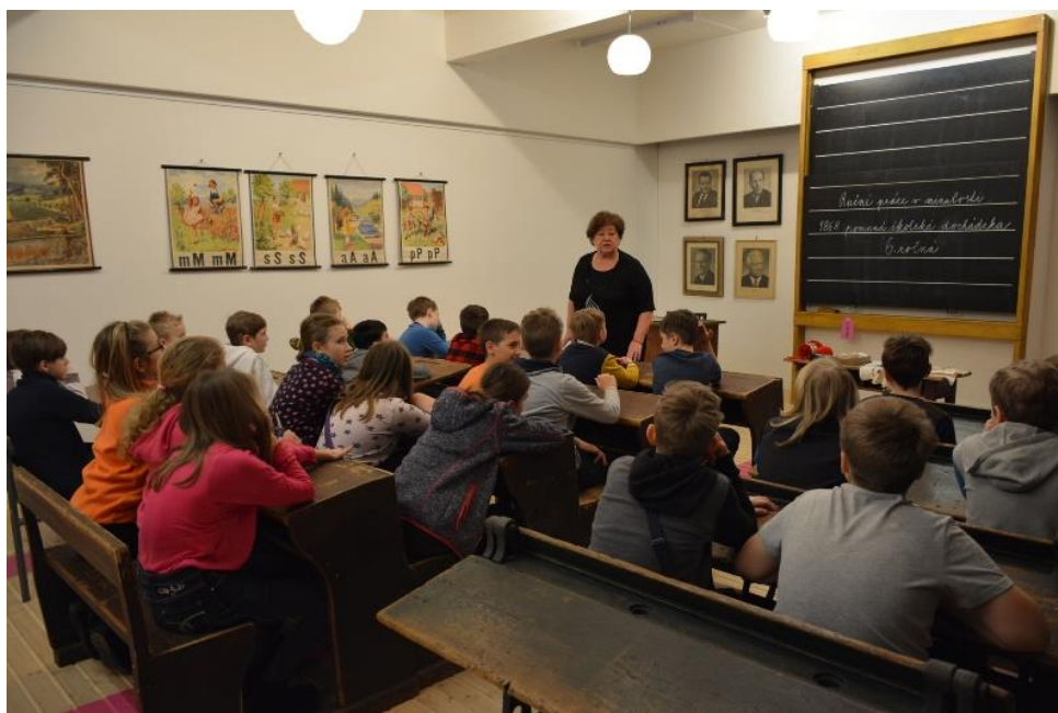
Úvod vzdelávacieho programu Ihla a háčik v zabudnutí o histórii vyučovania ručných prác vo výstavných priestoroch Múzea školstva a pedagogiky.

Program sa začínal rozprávaním o období zavádzania ručných prác do škôl, o tom, ako prebiehali, že boli prísne hodnotené a prečo boli vtedy pre žiakov také dôležité. Podstatná bola komunikácia so žiakmi a kladenie otázok, ktoré ich nútili zamyslieť sa nad významom samotného predmetu aj v širších súvislostiach (vlastná tvorba, úspora peňazí, ohľaduplnosť voči životnému prostrediu a pod.). Pocity z programu umocňoval aj priestor – historická školská trieda z troch období, v ktorej program prebiehal. Pre mnohé deti, ale aj pedagógov je zážitkom už len sadnúť si do drevenej lavice, najmä pri predstave, že ju pred sedemdesiatimi rokmi v slovenských školách „drali“ skutoční žiaci.