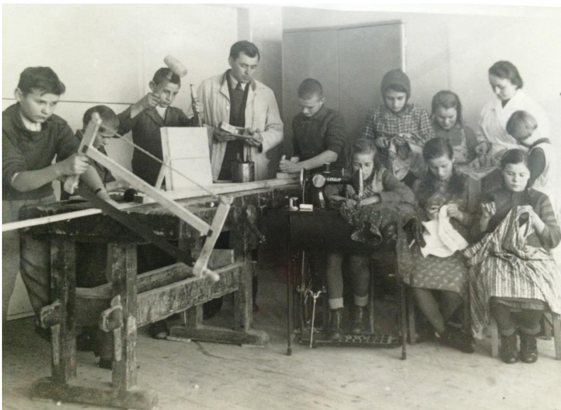
Hodina ručných prác. Ľudová škola v Trenčíne, 1939. Fotoarchív Múzea školstva a pedagogiky.

Obsahom predmetu u dievčat bolo získať zručnosti v šití, háčkovaní, pletení, v starostlivosti o domácnosť – pranie, varenie, stolovanie, v zhotovovaní vlastnej výbavy – periny, utierky, zástery, oblečenie, na vidieku kroje. Chlapci sa oboznamovali s pracovnými nástrojmi a ich údržbou. Na školách vznikali pracovné dielne, kde prakticky uplatňovali nadobudnuté vedomosti o materiáloch ako drevo, kov, železo. Neskôr sa pridali technické nástroje a iná technika.