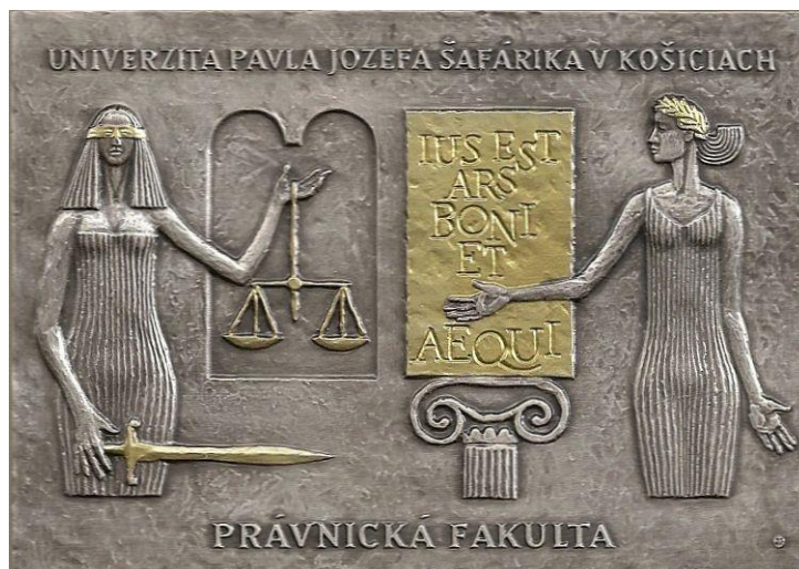
Obr. 3: Pamätná plaketa Právnickej fakulty UPJŠ v Košiciach. Výrobca Mincovňa Kremnica 2013. Medailér nesignovaný. Jednostranná plaketa z postriebného bronzu o rozmeroch 95 x 67 mm

Právnická fakulta od svojho vzniku sídli v budove bývalej Právnickej akadémie na Kováčskej ulici č. 26. Vzhľadom na nárast študentov a nedostatok priestorových kapacít pre výučbu a pre prácu katedier si fakulta postupne zabezpečovala aj ďalšie priestory. Samotný vzdelávací proces pri príprave právnikov na fakulte vychádzal z tradície, ale postupne sa aktualizoval v závislosti od spoločenských, politických a ekonomických zmien, pretože tie vyvolávajú nové právne prostredie. Výraznejšie zmeny v tomto smere nastali po Nežnej revolúcii a začiatkom tretieho tisícročia po vstupe SR do Európskej únie. Postupne podľa aktuálnych potrieb dochádzalo k usmerneniu, prípadne reštrukturalizácii štúdia, ktoré v súčasnosti v rámci bakalárskeho a magisterského štúdia má akreditovaný študijný odbor Právo. Nadväzne v doktorandskom štúdiu má fakulta akreditované tri študijné odbory: Teória a dejiny štátu a práva, Obchodné a finančné právo a Občianske právo. Výučbu na fakulte zabezpečujú pedagógovia z 8 katedier, 1 ústavu a z pracoviska právnych kliník. Okrem skvalitňovania pedagogického procesu je na fakulte venovaná pozornosť výskumu a vede. Právnická fakulta dbá na to, aby formovanie odborného profilu jej absolventov zodpovedalo potrebám spoločnosti. 1 Práve pri svojom 40. výročí fakulta nechala vyraziť plaketu, ktorou sa chcela odvdáčiť tým, ktorí sa výraznejšie pričinili o jej doterajší rozvoj.