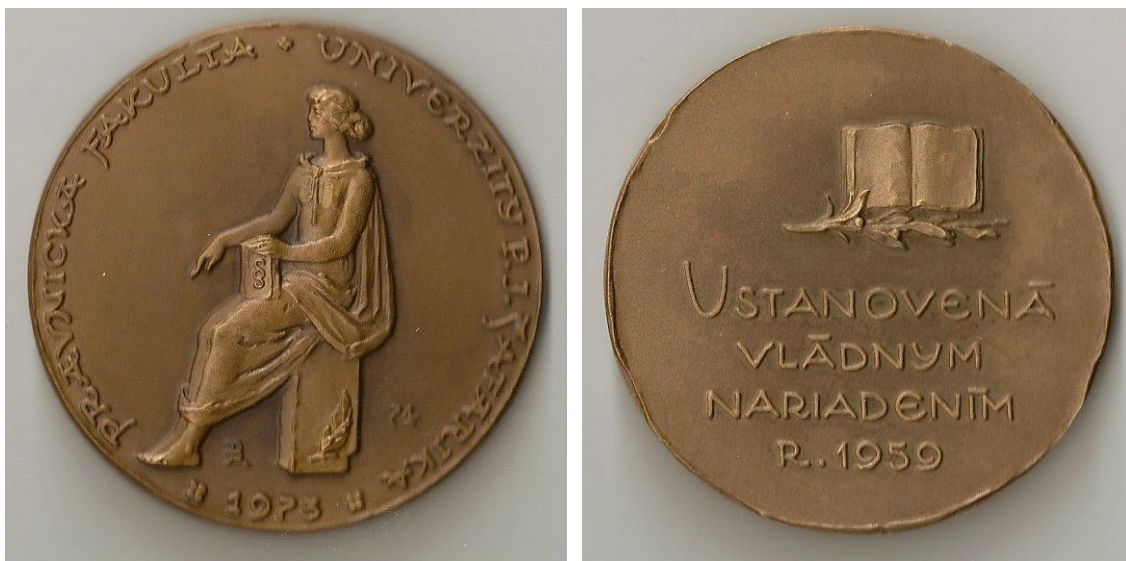
Obr.2: Medaila Právnickej fakulty UPJŠ v Košiciach. Výrobca Mincovňa Kremnica 1974. Medailér: Rudolf Pribiš. Medaila: a., r., patinovaný tombak, Ø 68 mm (obr. 2).

So vznikom fakulty nastal aj problém zabezpečenia insígnií pre hlavných predstaviteľov jej vedenia a v súvislosti s tým bola razená aj medaila prezentujúca vznik Právnickej fakulty UPJŠ v Košiciach v Mincovni Kremnica, ktorá slúžila na oceňovanie pracovníkov fakulty a univerzity, ale aj osobností a inštitúcií, s ktorými spolupracuje fakulta a výraznejšie prispeli k jej rozvoju.