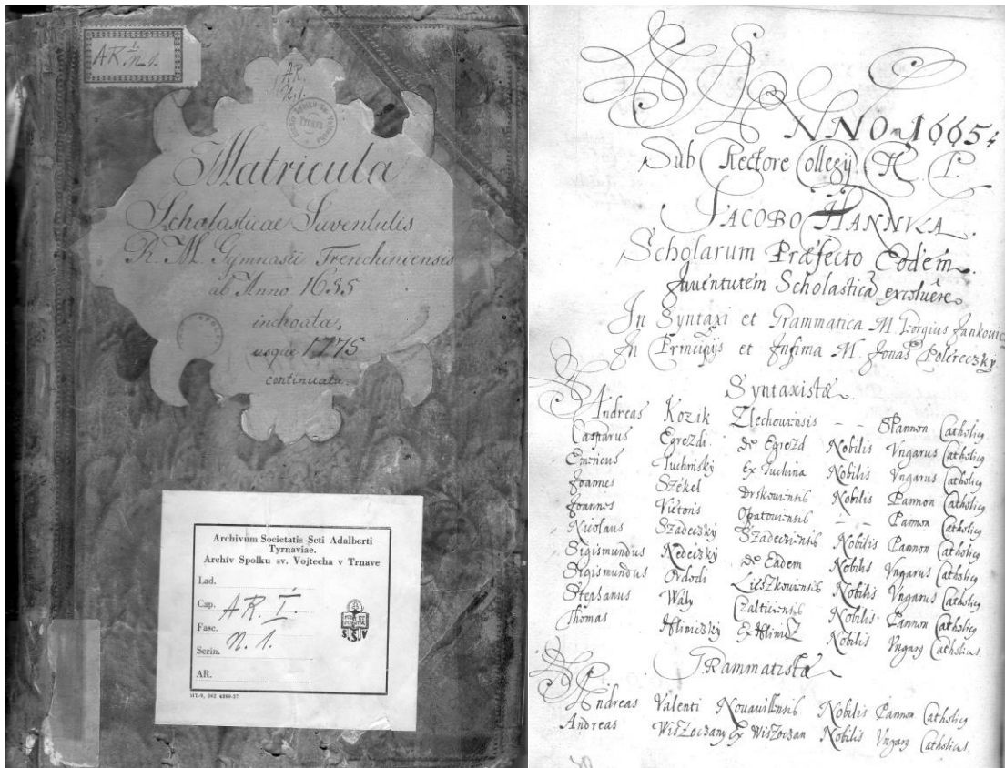
Obr. č. 1: Titulná strana a zápis z roku 1665 Matriculy Scholasticae

národnosti a vyučovalo sa po triedu poetae . 9 Záznamy sa zachovali až od roku 1655. Školský rok začínal zvyčajne v decembri a končil v septembri skúškami. Matrika Matricula Scholasticae Juventutis R. M. Gymnasii Trenchiniensis ab Anno 1655 inchoata, usque 1755 continuata sa zachovala v Spolku svätého Vojtecha v Trnave pod signatúrou AR I., n. 1.